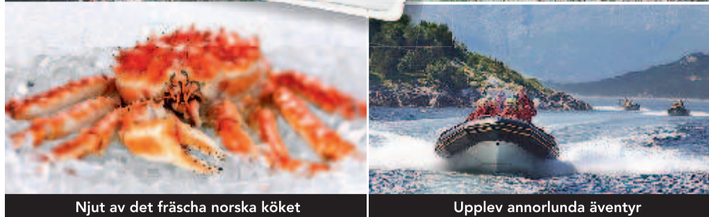
Njut av det fräscha norska köket