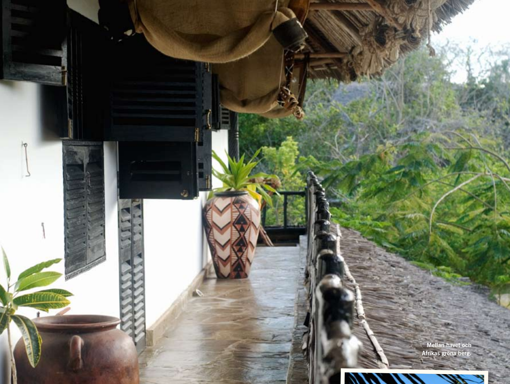
Mellan havet och Afrikas gröna berg.