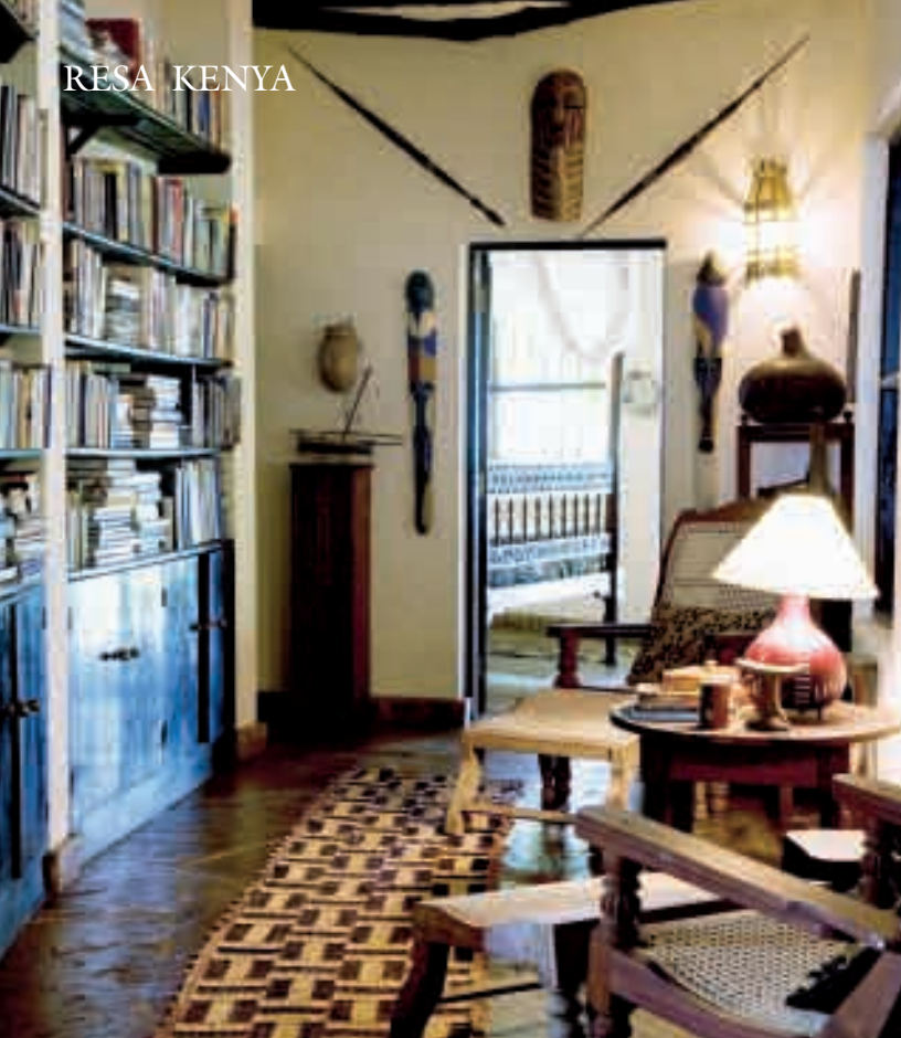
Kinondo Kwetus bibliotek. Garanterat fritt från övervakande bibliotekarier och länekortsvång. »Gästerna tar med sig böcker hit, och ibland tar de med sig några hem. Ett levande bibliotek!» säger Ida.