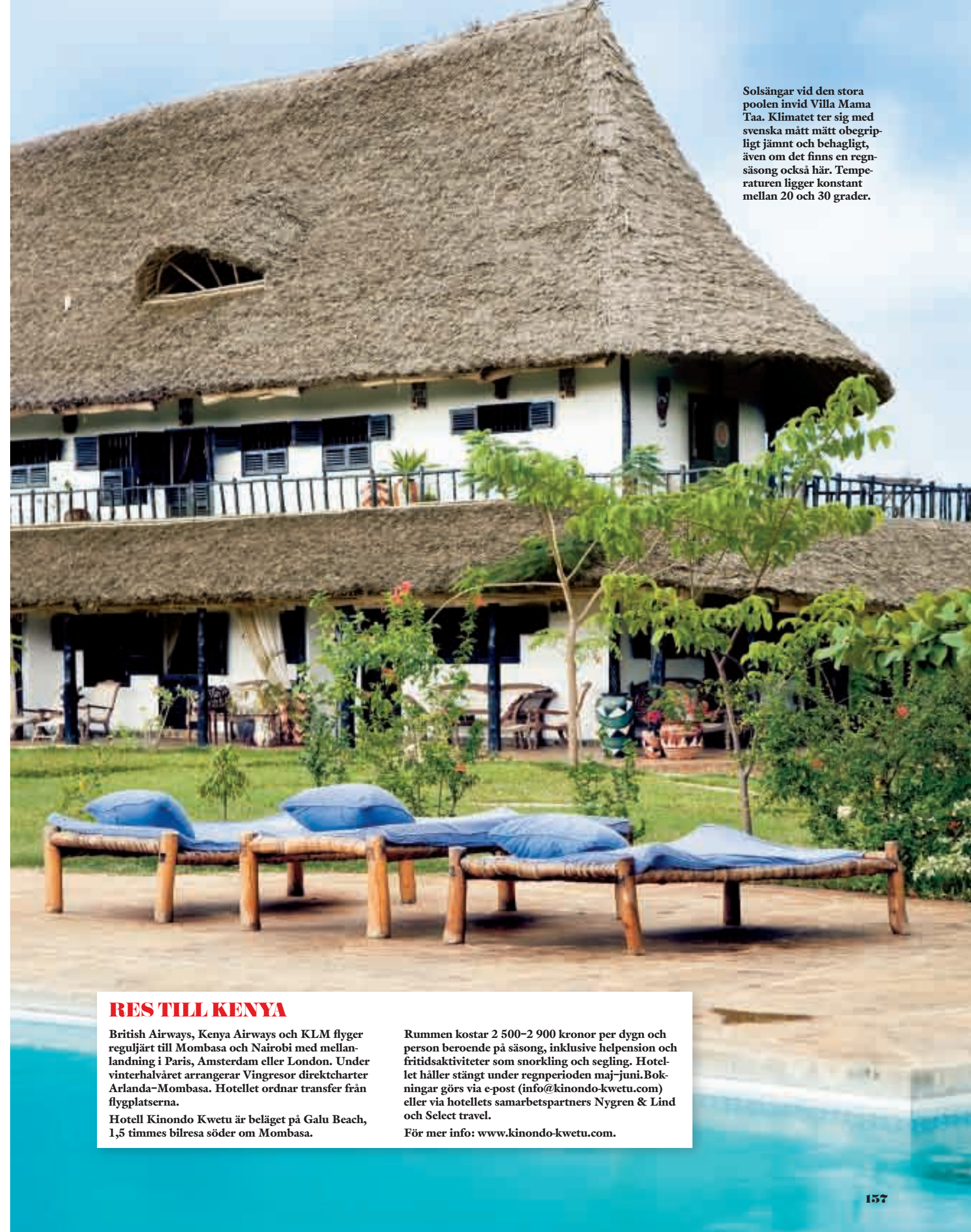
Solsängar vid den stora poolen invid Villa Mama Taa. Klimatet ter sig med svenska mått mätt obegripligt jämnt och behagligt, även om det finns en regnsäsong också här. Temperaturen ligger konstant mellan 20 och 30 grader.