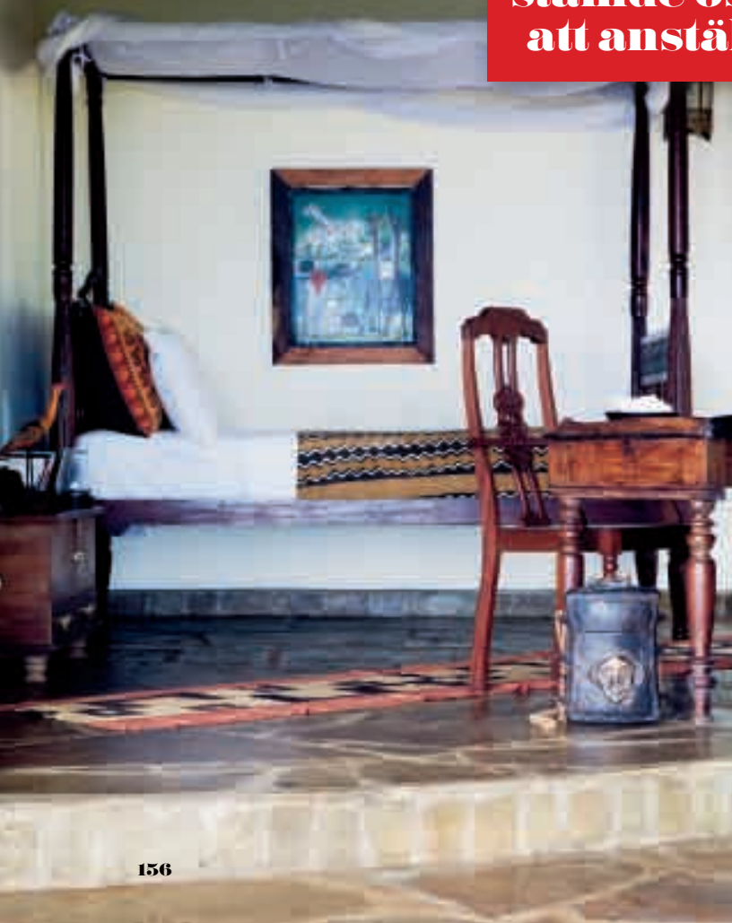
Enkelrum i beachstugan Ubani Cottage med fem meter till stranden.

är i en mycket fattig före detta brittisk koloni – skulle naturligtvis kunna sticka ordentligt i ögonen. Om det inte vore så att Ida och familjen Andersson inte bara är geografiskt utan också socialt förankrade och involverade i regionen.